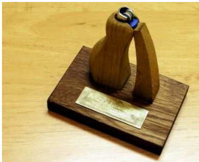
Křesadlo 2001 - 2002

Za rok 2002 to bylo celkem 31 křesadel, které kromě Prahy (10x) předávali naši partneři v šesti městech – Česká Lípa (3x), České Budějovice (4x), Pelhřimov (3x), Olomouc (3x), Ústí nad Labem (5x) a Zlín (3x).